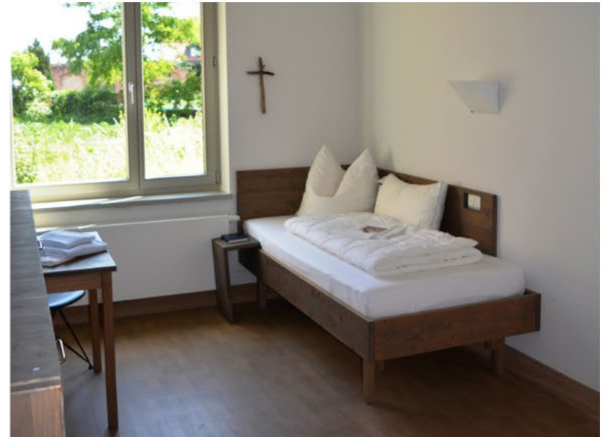
Blick in die Räumlichkeiten unseres Hauses

carola-mai@gmx.de Tel.: 0175 2486 109 www.ikonen-mai.de